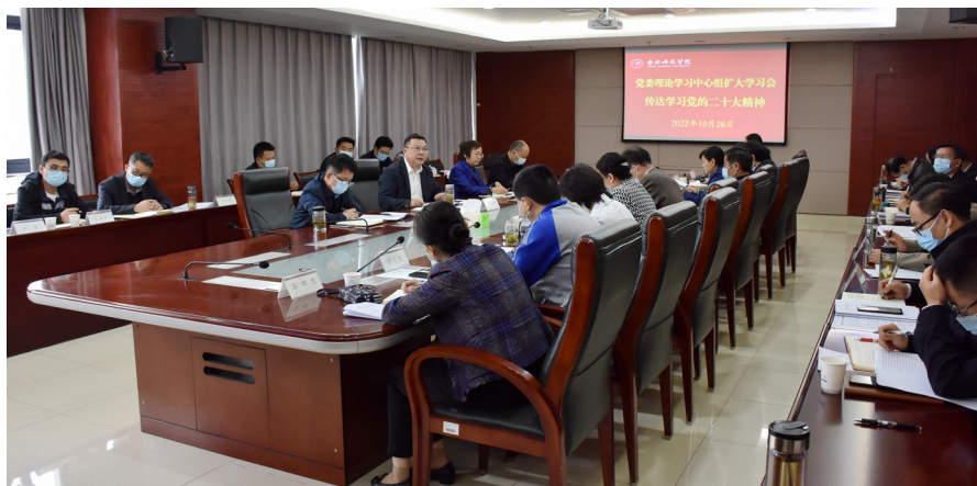
10月26日上午,学院举行党委理论学习中心组扩大学习会

会议认为,党的二十大报告举旗定向、思想深邃、气势磅礴、催人奋进,是高举中国特色社会主义伟大旗帜、谱写全面建设社会主义现代化国家新篇章的政治宣言和行动纲领,是一篇闪耀着马克思主义真理光芒的纲领性文件,必将极大地促进全党全军全国各族人民奋进新征程、建功新时代,必将极大地凝聚全体中华儿女为实现中华民族伟大复兴团结奋斗。