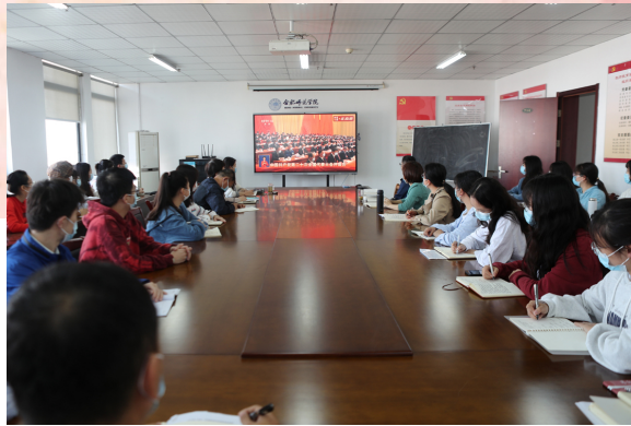
各二级学院党组织分别组织师生在各自学院集中收看

党的二十大开幕会直播,聆听了习近平总书记的报告,我深切感受到中国发展最强劲的脉搏,为党和国家在新时代十年的伟大变革中,取得的全方位、开创性的成就和变革感到自豪。作为一名基层党组织工作者,我将认真学习贯彻党的二十大精神,落实立德树人根本任务,围绕人才培养中心、服务学生成长大局,引导外国语学院青年大学生坚定不移听党话、跟党走,在学好外语专业的同时,熟知我国优秀传统文化,树立社会主义核心价值观,向世界讲好中国故事、传播好中国声音。