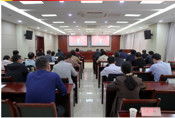
院领导及机关干部在锦绣校区行知楼2011会议室集中收看大会盛况

本报讯 10月16日上午10时,中国共产党第二十次全国代表大会在人民大会堂隆重开幕,学院多层次组织师生积极收看党的二十大开幕会盛况,认真聆听、学习、热议习近平总书记代表中国共产党第十九届中央委员会向大会作的报告。