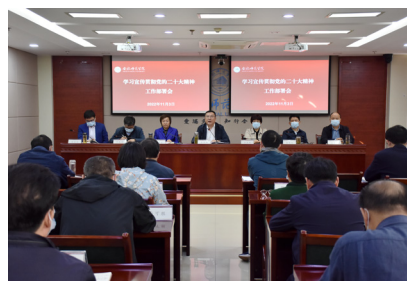
11月3日下午,学院在行知楼2011会议室召开学习宣传贯彻党的二十大精神工作会议

会议要求,要坚持提高站位,充分认识党的二十大重大意义,要深刻领会党的二十大精神,深刻领悟“两个确立”的决定性意义,把“两个确立”“两个维护”作为最高政治原则和根本政治规矩,坚定增强“四个意识”、坚定“四个自信”、做到“两个维护”的政治自觉;要深刻领会党的二十大精神,深刻领悟党的二十大的重大现实意义,坚定全面建设社会主义现代化国家的行动自觉;要深刻领会党的二十大精神,深刻领悟党的二十大的重大历史意义,坚定以中国式现代化全面推进中华民族伟大复兴的历史自觉,以高度的政治责任感和强烈的历史使命感,心无旁骛投身到地方应用型高水平大学